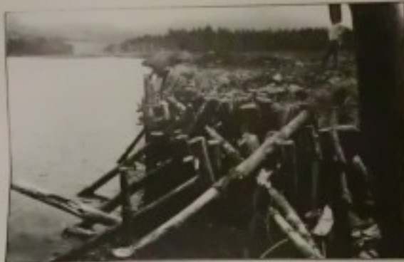
«Nosotros insistimos hasta el momento una reparación prioritaria».