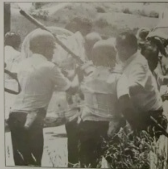
«Denunciamos la actuación salvaje de la Entesa contra ríos, marjales y zonas marjales».

«NO NOS Oponemos A LA REPARACION DE DICHO DIQUE».