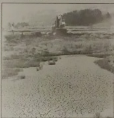
Tras la restauración de la muna, los ecologistas denuncian la muerte de varias especies marplatenses.

También se realiza un estudio del impacto, que es enviado a la Consejería del Medio Ambiente del P.V., en él se decía textualmente: «Que la obra pretende devolver el terreno situado en la Muna, entre el ferrocarril y el corte de la Ría, a la situación en que se encontraba antes de las inundaciones de agosto de 1983. Sobre este terreno, si que se presume existe una estructura de propiedad de carácter minifundista, fruto de parcelaciones de terrenos