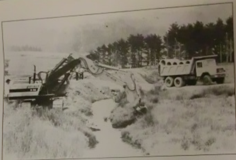
Un momento del corte de la muna.

se ha limitado a la reparación de la Muna afectada, tal como en su día acordó la asamblea de afectados. De esta manera se ha suplido a la ineficacia administrativa - como hemos indicado - de cuatro años de espera, y de sentirse engañados. Yo como Alcalde de Murueta he concedido LA LICENCIA, que es totalmente legal - y que en este caso ni siquiera hacía falta, limitándome a inspeccionar para que se respetara lo acordado.