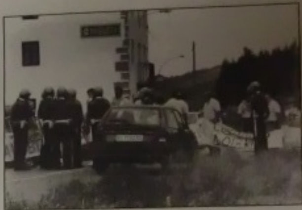
«Es la lucha de un pueblo en defensa de sus tierras».

El nos responde amenazando «que si nos portamos bien y no vamos a los TRIBUNALES etc., tal vez con grandes posibilidades nos repararán posteriormente, al deslin-