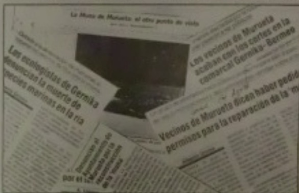
La prensa se ha hecho eco complacido de la problemática desatada por la reparación de la ría.

El día 14 de Junio de 1987 se corta por primera vez la carretera, con la presencia de las cámaras de E.T.B., Prensa y demás medios de comunicación. Tena lugar una actuación durísima por parte de la ERTZANTZA que trata de liberar el